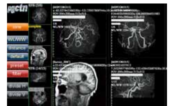
医療連携システム部門 Section of Clinical Cooperation System