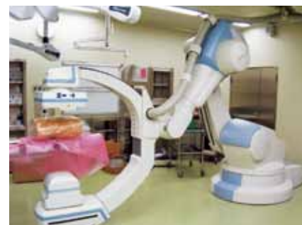
遠隔支援手術ロボット | da Vinci S