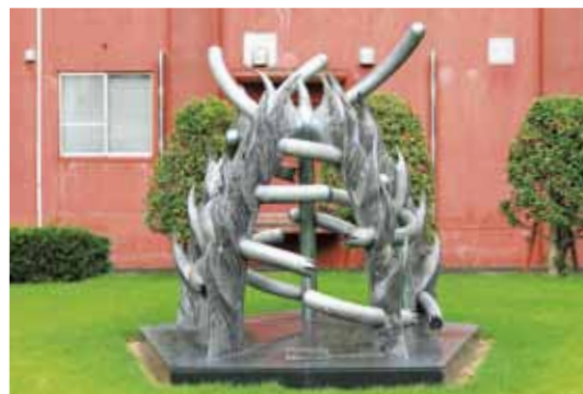
動物慰霊碑 | Monument for Animals Sacrificed in Experiments