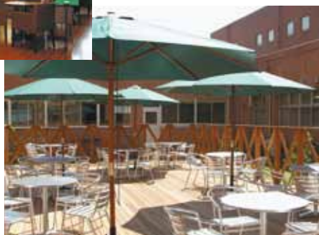
テラス | Terrace