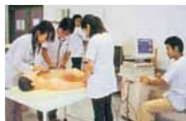
地域包括医療教育部門 Section of Medical Education