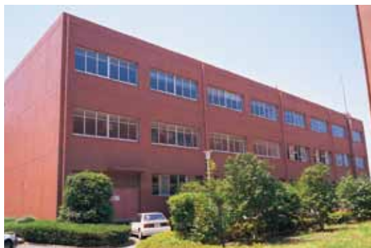
基礎実習棟 | Basic Science Laboratory Building