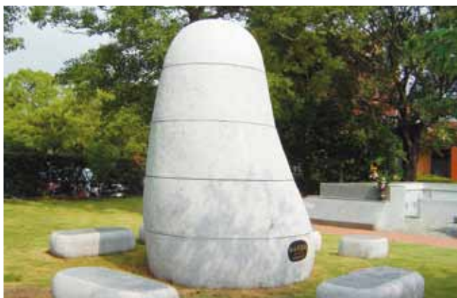
慰靈碑 | Cenotaph