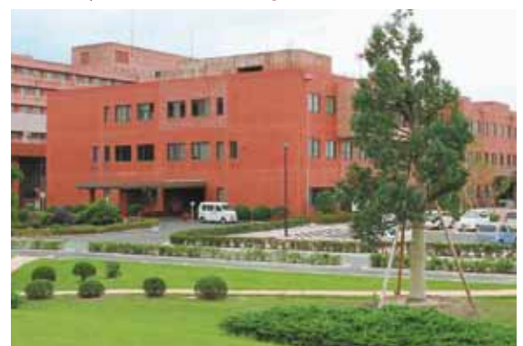
管理棟 | Administration Building