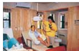
福祉健康科学 (社会生活行動支援)部門 Section of Physical and Behavioral Support System