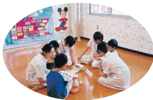
小児病棟 プレイルーム | Play Room in Pediatric ward