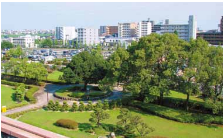
病院玄関前 | Frontal view from the hospital roof