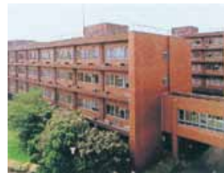
基礎研究棟(手前) Basic Research Building (Front) 臨床研究棟(奥) Clinical Research Building (Back)

重粒子線がん治療学 Heavy Particle Therapy and Radiation Oncology