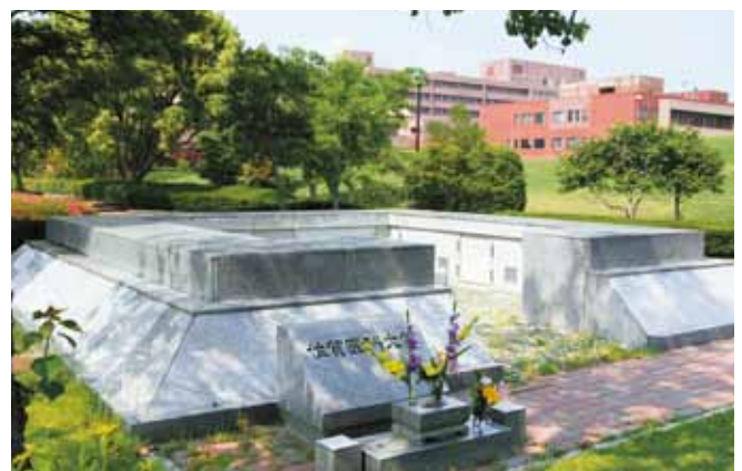
慰靈堂(納骨堂) | Charnel House for Cadavers