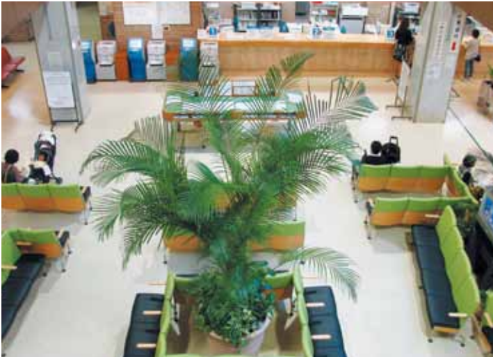
病院玄関ホール | Entrance Hall