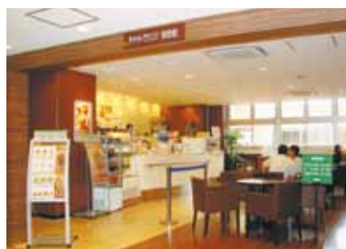
チャットラウンジ | Chat Lounge