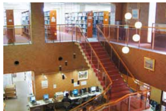
図書館内部 | Library (interior)