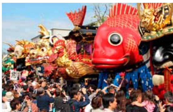
唐津くんち | Karatsu Kunchi