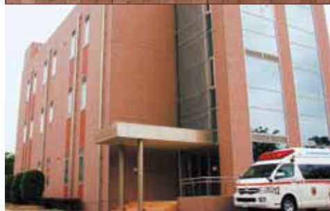
地域医療支援センター Community Medical Support Center