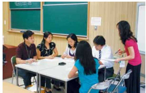
ハワイ大学学生によるPBL(Problem Based Learning)風景 A group of medical students of University of Hawaii are doing PBL.