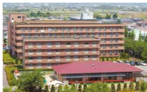
看護師宿舎・医学部宿舎・こどもの杜保育園 Nursing Professionals' Housing・Medical Schools' Housing・ Nursery School Kodomo no Mori