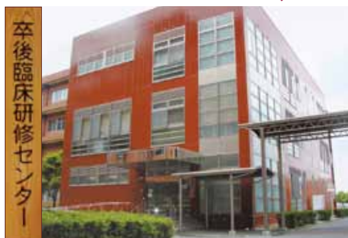
卒後臨床研修センター Center for Graduate Medical Education Development and Research