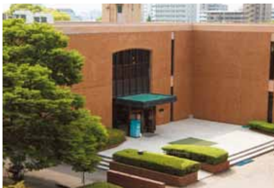
附属図書館医学分館 | The Medical Library