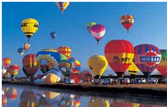
佐賀インターナショナルバルーンフェスタ Saga International Balloon Fiesta