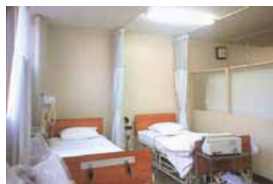
保健管理センター | Health Administration Center