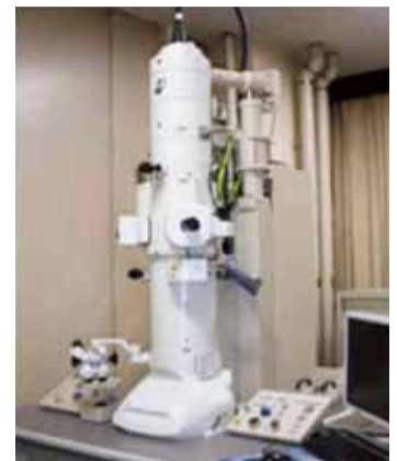
透過型電子顕微鏡 | Transmission Electron Microscope (TEM).