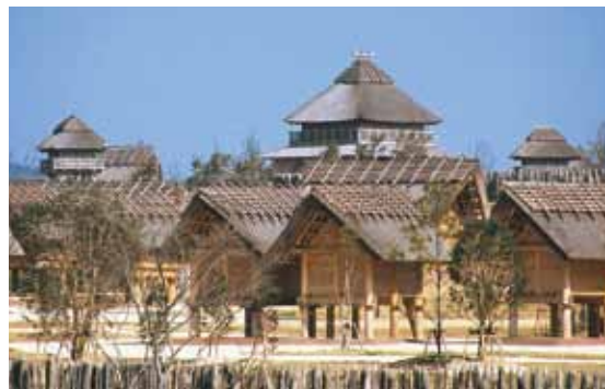
吉野ヶ里遺跡 | Yoshinogari Remains