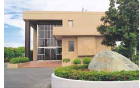
非常勤講師等宿泊施設(思誠館) Guest House (Shiseikan)