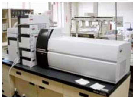
液体クロマトグラフ質量分析計 | Liquid Chromatograph Mass Spectrometer (LC-MS).