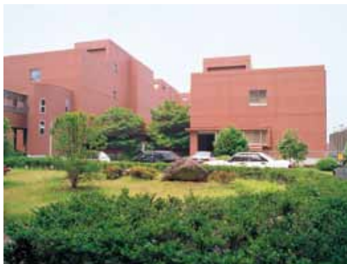
建物全景生物資源開発部門(左)と放射性同位元素利用部門(右) | Buildings of the Divisions of Biological Resources and Development (Left) and Radioactive Compounds Utility (Right).