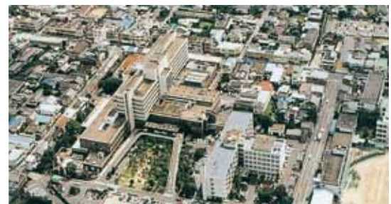
地方独立行政法人佐賀県立病院好生館 Koseikan Prefectural Hospital