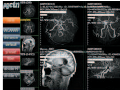
数理解析部門(教育IR室) Division of Mathematical Analysis(Office of institutional Research)