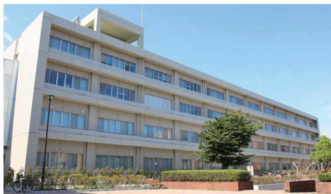
基礎研究棟 | Basic Research Building