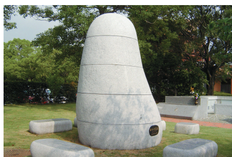
慰霊碑 | Cenotaph