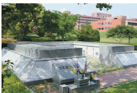
慰霊堂(納骨堂) | Charnel House for Cadavers