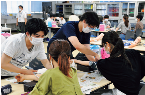
医学教育開発部門 Division of Medical Education Development