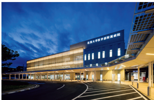
病院正面玄関(夕景) The main entrance of the hospital (Evening View)