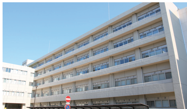
臨床研究棟 | Clinical Research Building