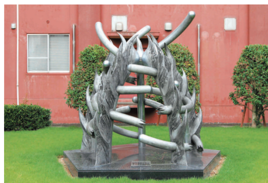
動物慰霊碑 | Monument for Animals Sacrificed in Experiments