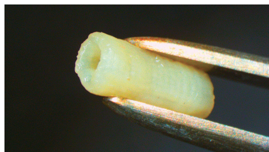
細胞製人工血管 Cellular Vascular Graft