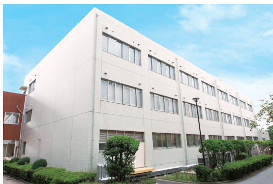
基礎実習棟 | Basic Science Laboratory Building