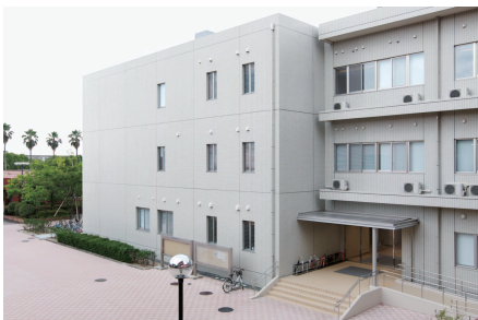
校舎講義棟 | Lecture Hall Bldg