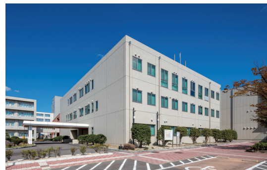
管理棟 | Administration Building