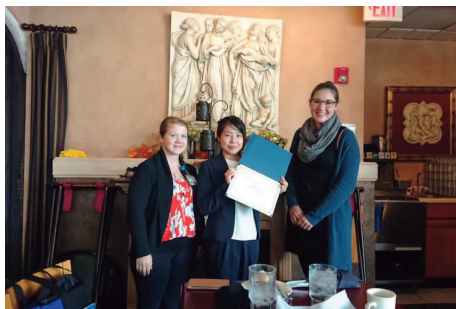
アメリカ・Mayo Clinicにおける短期看護研修 Short-term nursing training at Mayo Clinic in the United States