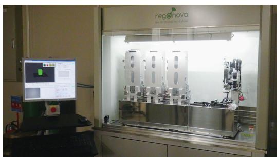
バイオ3Dプリンタ Bio-3D Printer

We try to make artificial tissues from human cells for patients suffering from disease and injury and verify the efficacy and safety of them. In the future, we will develop the artificial tissues by using autologous cells, and work on the treatment of various diseases.