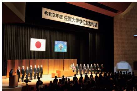
学位記授与式 | Gureaduation Ceremony