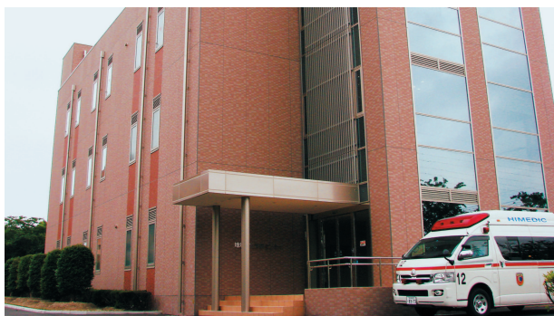
地域医療支援センター | Community Medical Support Center