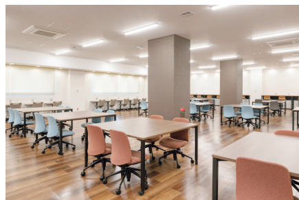
コラボレーションエリア | Collaborative Study Space