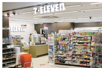
コンビニエンスストア | Convenience store