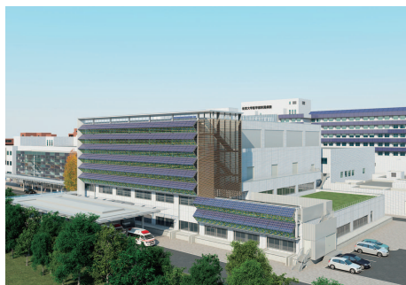
南診療棟 | South Clinical Building