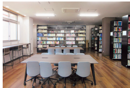
図書館内部 | Library (interior)