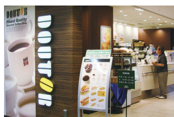
コーヒーショップ | Coffee shop