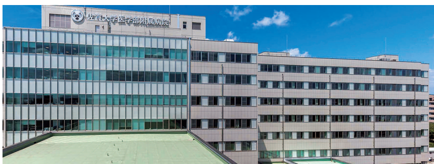
東病棟 | East Ward