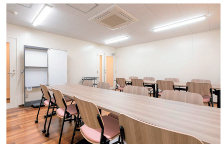
ディスカッションルーム | Discussion Room