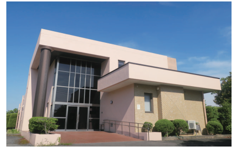
非常勤講師等宿泊施設(思誠館) Guest House (Shiseikan)