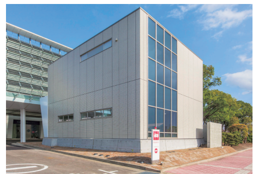
トリアージ棟 | Triage Building