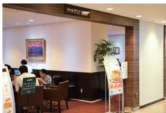
談話室 | Chat Lounge