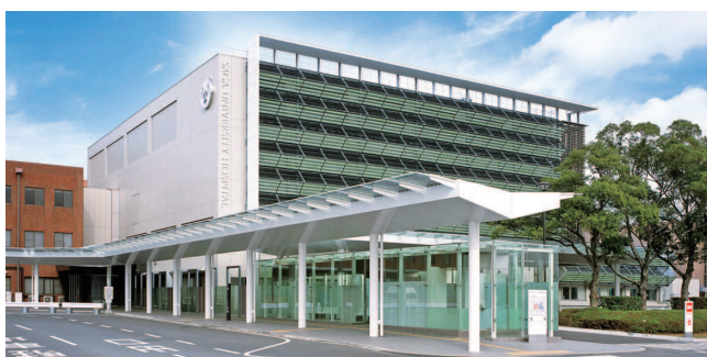
南診療棟 | South Clinical Building