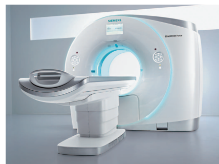
X線CT | SOMATOM Force