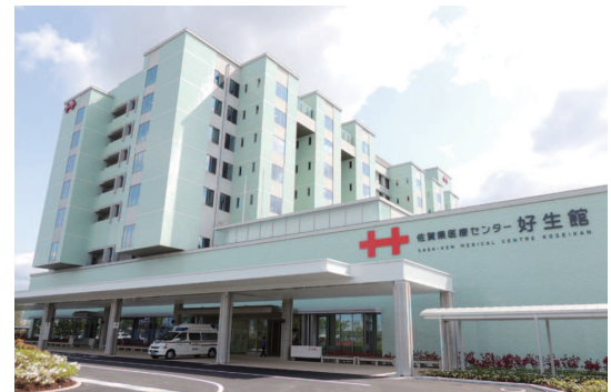
地方独立行政法人佐賀県医療センター好生館 SAGA-KEN MEDICAL CENTRE KOSEIKAN