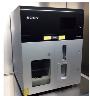
セルソーター | Cell Sorter.