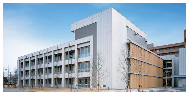
北病棟 | North Ward