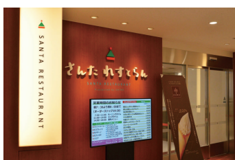
レストラン | Restaurant