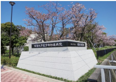
正門 | Front Gate