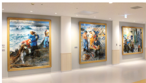
院内画廊 | Art Gallery