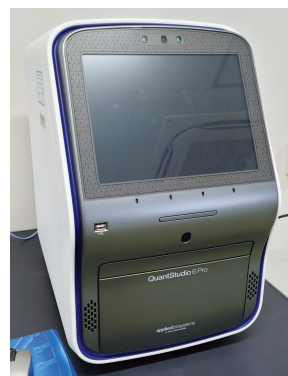
リアルタイムPCRシステム Real-Time PCR System