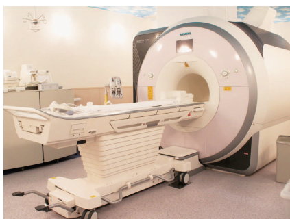
MRI | MAGNETOM Prisma