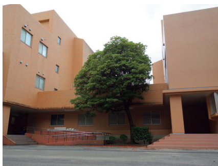
生物資源開発部門(左)と放射性同位元素利用部門(右) | Buildings of the Divisions of Biological Resources and Development (Left) and Radioactive Compounds Utility (Right).