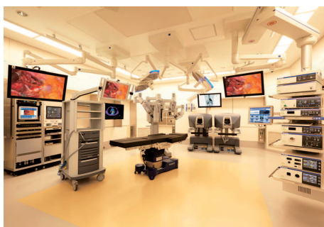
3D内視鏡手術室 | Operating Room