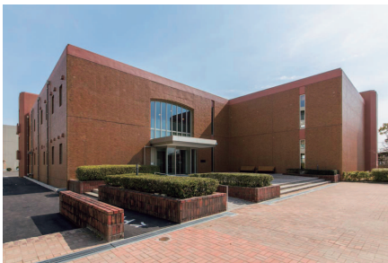
附属図書館医学分館 | The Medical Library