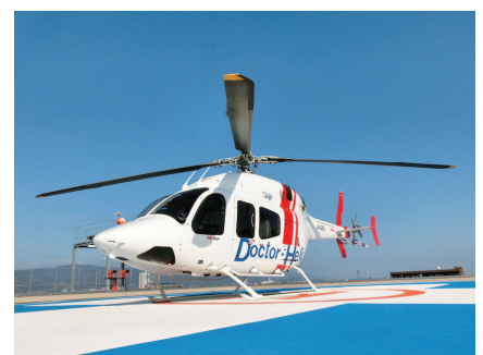
ドクターヘリ | Doctor Helicopter