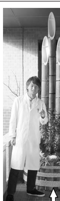
おタイムは何をさしているのですか? 最近では忙しくて読めないのですが、江戸川乱歩賞作品や村上春樹はよく読んでいましたね。それから土曜深夜の「カウントダウンTV」は、今も録画して見えていますよ。録画して見えていますよ。録画して見えていますよ。

皆さんの自宅によつては、お正月に門松を飾っていたであろう。元来、門松は、年神様の依り代(新年に各家を訪れる神様が宿る場所)として家の門に置かれてきた。さて、附属病院正面玄関横に大きな門松が