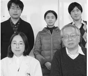
おタイムは何をさしているのですか? 最近では忙しくて読めないのですが、江戸川乱歩賞作品や村上春樹はよく読んでいましたね。それから土曜深夜の「カウントダウンTV」は、今も録画して見えていますよ。録画して見えていますよ。録画して見えていますよ。