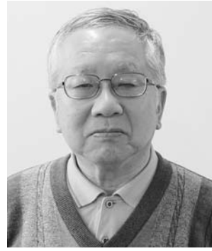
生体構造機能学講座 神経生理学分野 教授